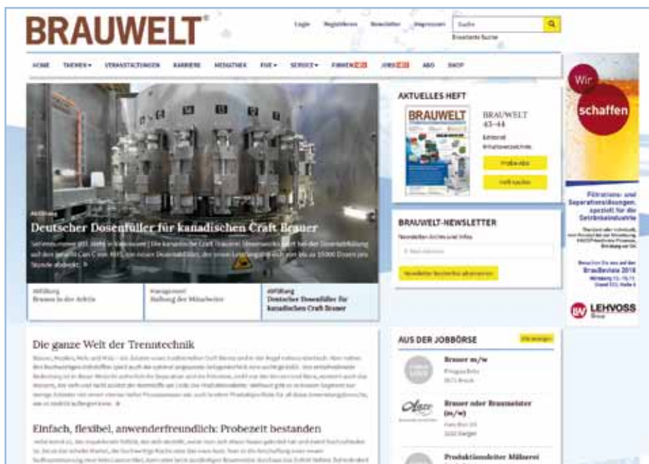
So sieht die neue Startseite aus

gen können, vom Rohstofflieferanten über den Anlagenbauer bis hin zum Anbieter für Werbemittel – in der Einsteigerversion kostenlos, das Standard- und das Premiumangebot sind dann kostenpflichtig. Unsere Firmendatenbank bietet eine ideale Plattform für alle, die einen Zulieferer für einen bestimmten Bereich der Brau- und Getränkebranche suchen. Neben detaillierten Infos zu den Unternehmen inklusive Kontaktinformationen findet man dort auch Nachrichten, Bilder, Videos, Produktneuheiten und Veranstaltungshinweise. So lässt sich bequem der passende Dienstleister oder Anbieter für die verschiedensten Anliegen finden. In dieses neue Angebot für unsere BRAUWELT-Leser haben wir viel Zeit und Arbeit investiert. Zu finden ist es auf der Website unter dem Reiter Firmen. Der Navigationspunkt FIVE (Firmen | Institute | Verbände | Education) verrät alles, was unsere Leser über die Unternehmen, Institute,